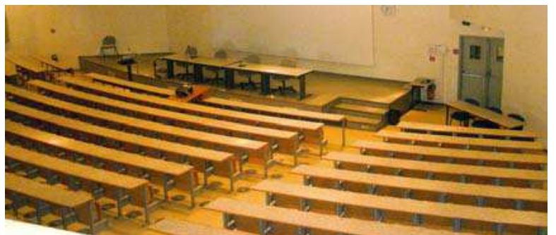
L'amphi de 350 places