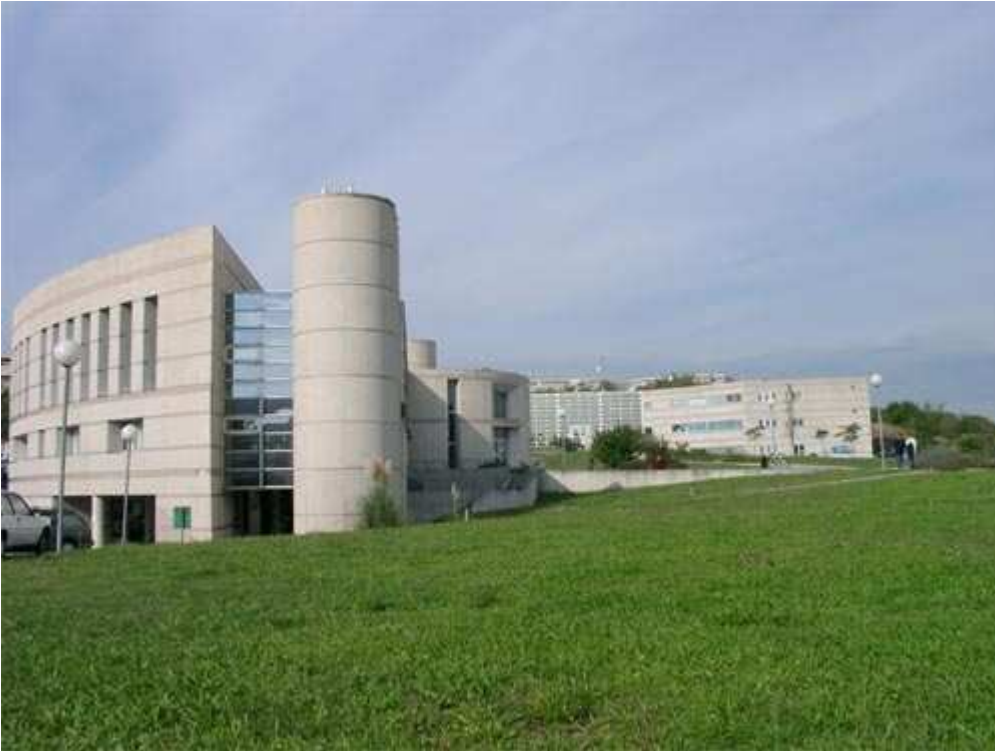
Le bâtiment de l'UPM

Ce bâtiment moderne, situé près des hôpitaux et desservi par la ligne 1 du tramway, accueille une bibliothèque, des salles de cours et un amphi ainsi qu'une salle informatique réservée aux étudiants.