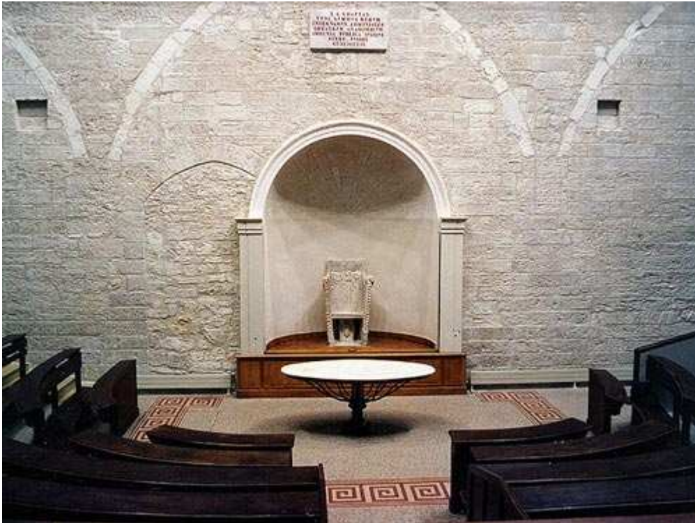
Le Theatrum Anatomicum

Situé en centre ville, il accueille le bureau du Doyen et les services administratifs ainsi que la Bibliothèque, le Musée Atger et le Musée d'Anatomie.